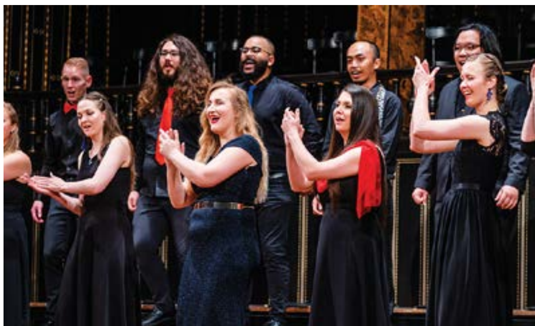
The World Youth Choir Alumni in Budapest in 2023

今回の世界青少年合唱団は、ドイツ青少年管弦楽団 (Bundesjugendorchester) とともにベートーヴェン作 交響曲