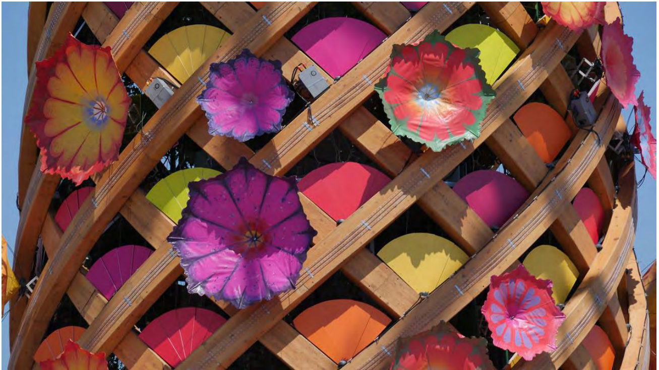
Expo Milano, the Tree of Life