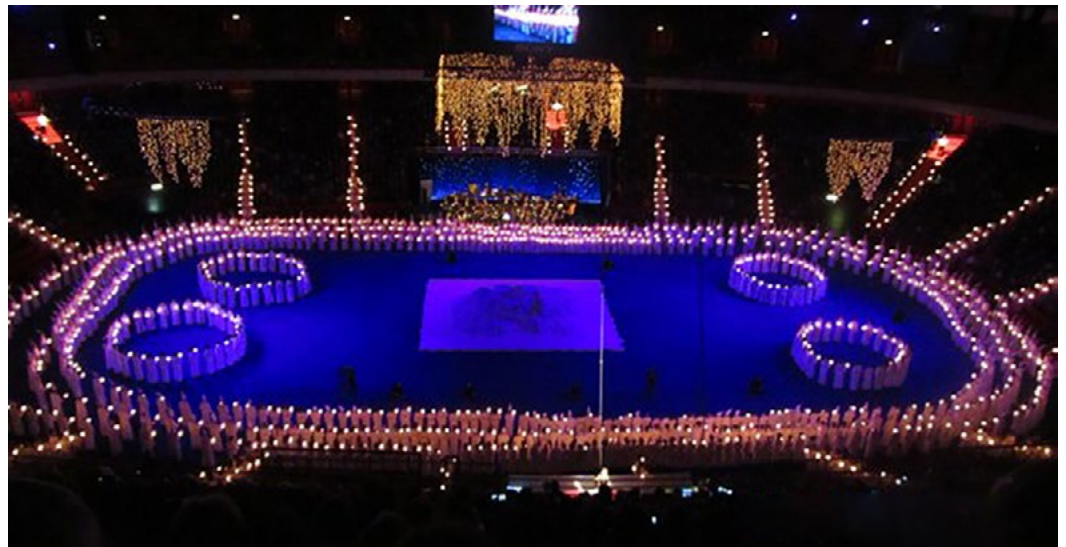
1.400 Sangerinnen und Sanger der Adolf Fredriks Musikklassen und des Stokholmer Musikgymnasiums wahrend eines Lucia Konzerts, das sie wahrend des Weltchortags feierten.