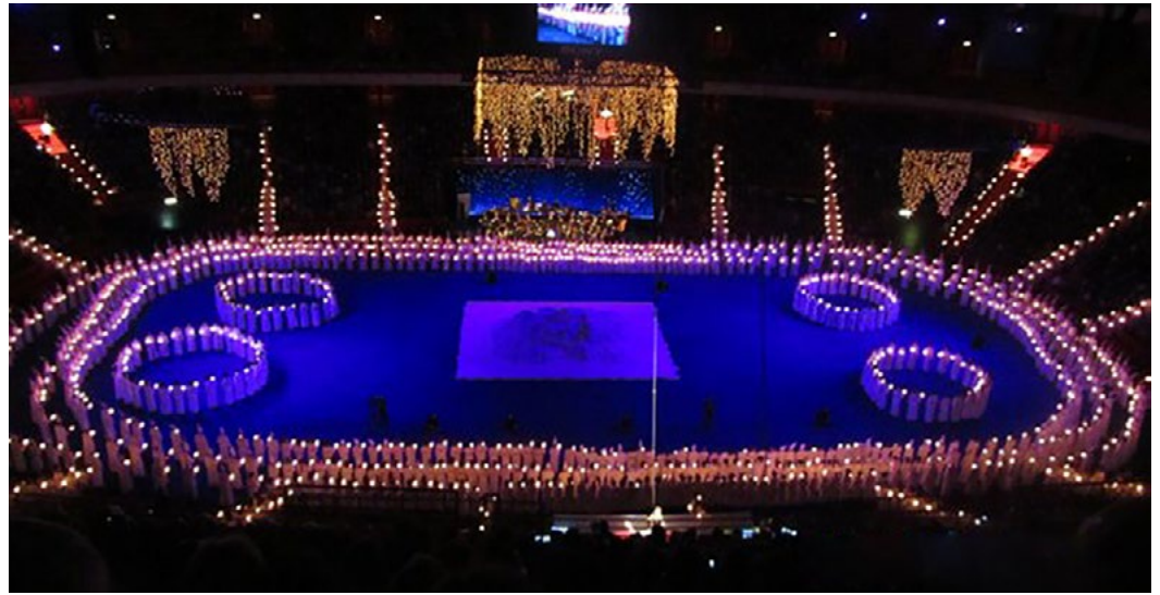
1400 Singers from Adolf Fredriks Music Classes and the Stockholms Musikgymnasium during a Lucia concert celebrated together with the World Choral Day