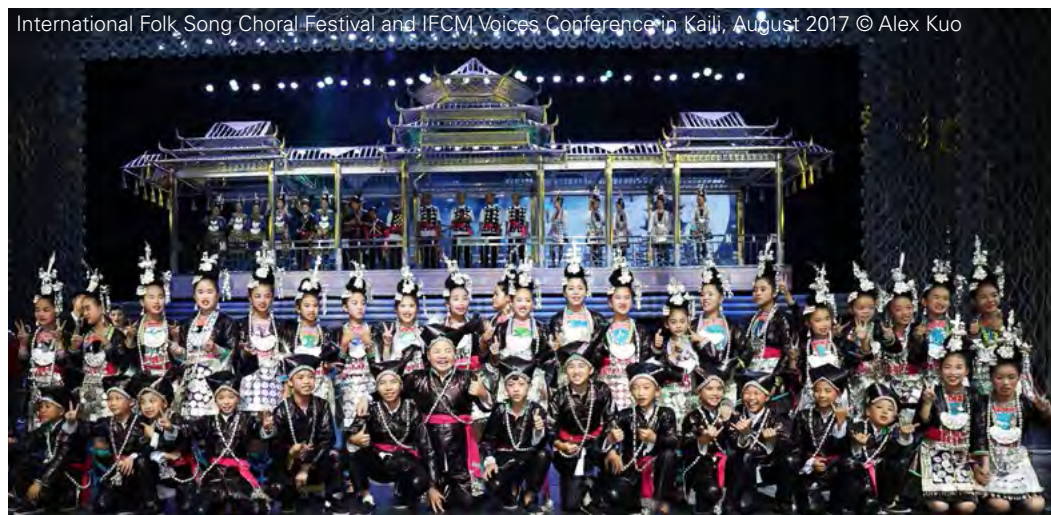
International Folk Song Choral Festival and IFCM Voices Conference in Kaili, August 2017

Se siete interessati, spedite il seguente materiale a office@ifcm.net entro il 15 febbraio 2018: una lettera di motivazione, CV del coro e del direttore, fotografie, dettagli sulla persona di riferimento, link a registrazioni.