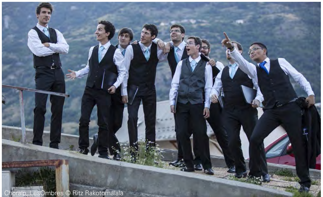
Choralp, LesOmbres