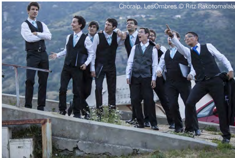
Choralp, LesOmbres

問い合わせ先: choralp@gmail.com ウェブサイト: www.choralp.fr