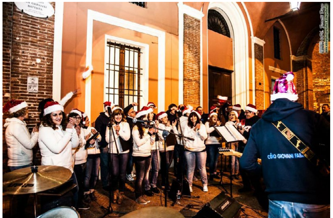
Coro Giovani Fabrianesi, Italy, celebrating the World Choral Day (2014)

Für Informationen über den virtuellen Chor können Sie Kontakt aufnehmen mit der IFCM unter communication@ifcm.net und den Organisatoren in Caracas unter info@ciccag.org oder unter: https://www.ciccag.org/en/virtual-choir-voxpopuli