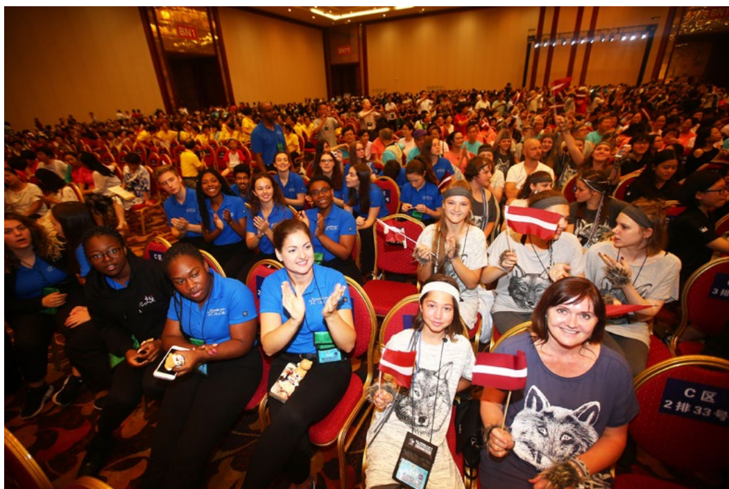
China International Chorus Festival Competition 2018