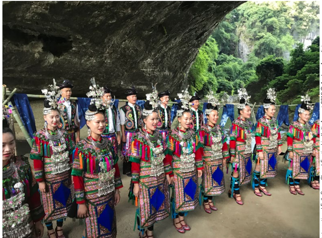
International Folk Song Choral Festival in Kaili, August 2018

Plus d'infos sur les conditions de voyage des chœurs voulant participer à un, deux ou trois festivals