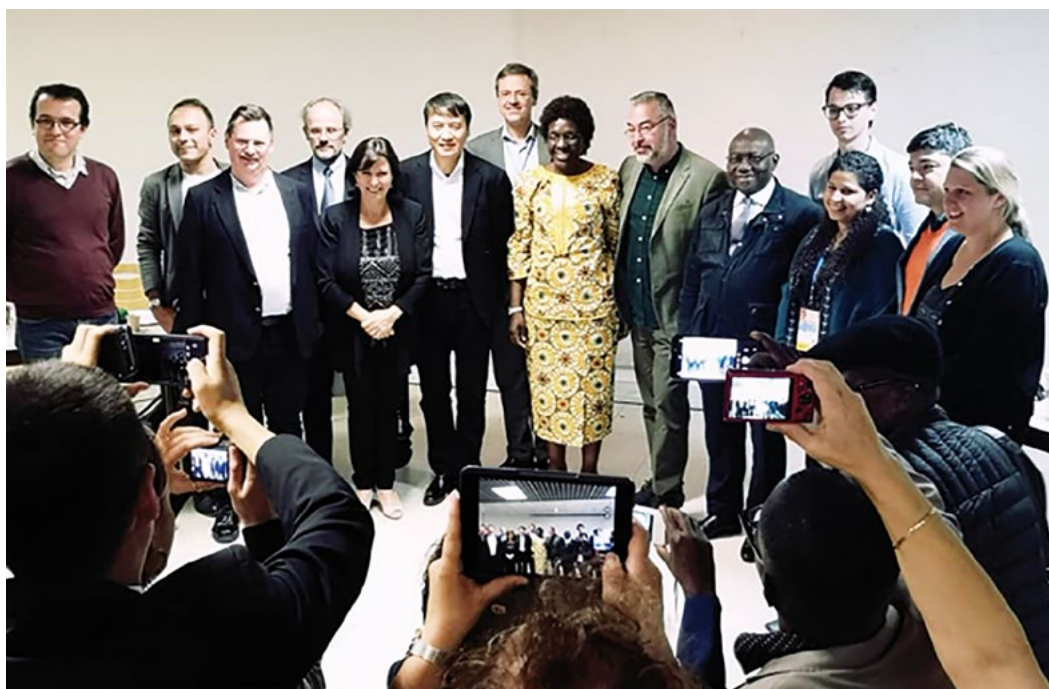
The new leadership team of the International Music Council