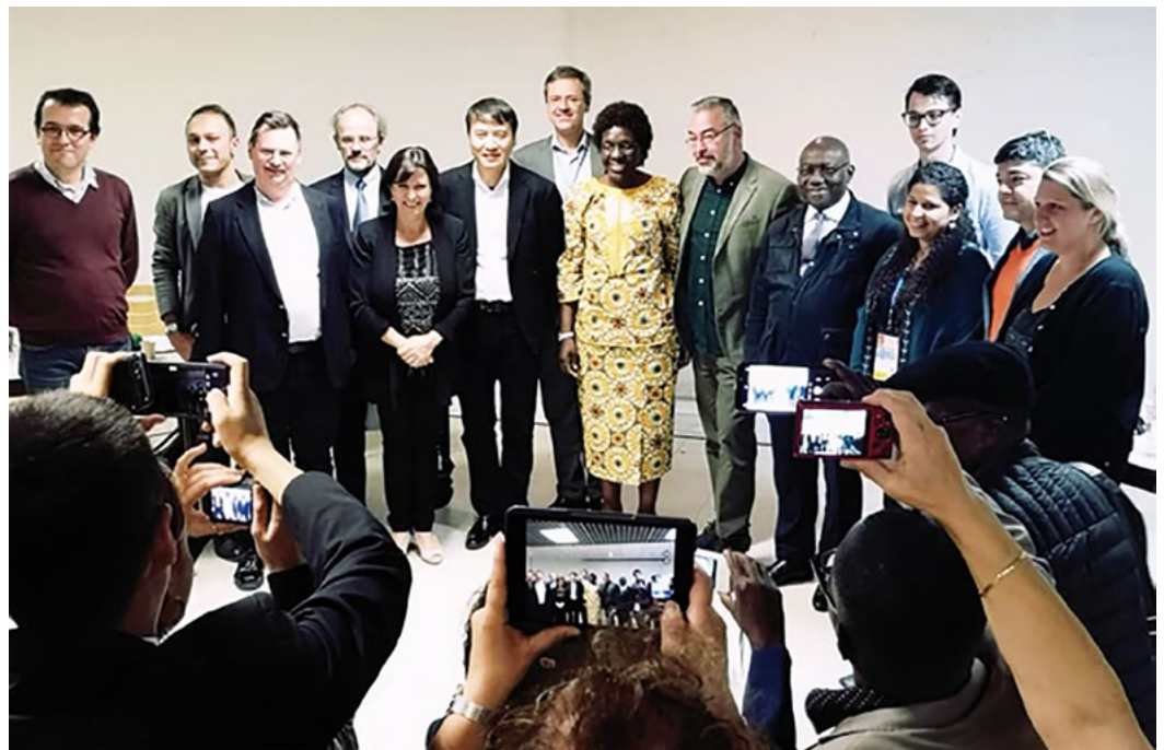
The new leadership team of the International Music Council