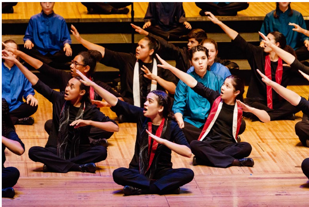
Gondwana © Sam Allchurch