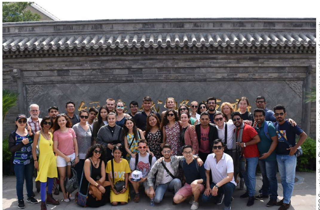
SCO Countries Youth Choir Singers visiting the ancient residence of generals