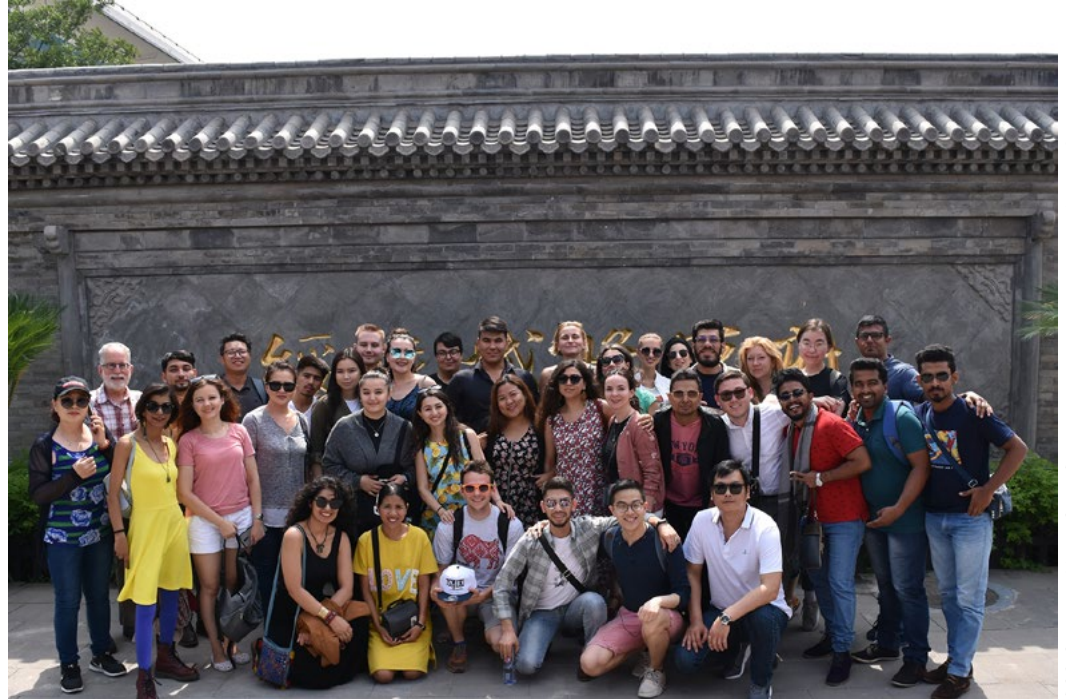
SCO Countries Youth Choir Singers visiting the ancient residence of generals

REPertoire aus 10 Ländern (Afghanistan, Weißrussland, China, Indien, Mongolei, Iran, Kasachstan, Russland, Türkei, Usbekistan) in 12 Sprachen (Arabisch, Weißrussisch, Dari, Englisch, Farsi, Hindi, Kasachisch, Mandarin, Mongolisch, Russisch, Türkisch, Urdu, Usbekisch).