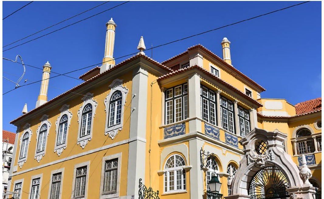
New head office of IFCM, Palacete dos Condes de Monte Real, Lisbon

Die IFCM freut sich mitteilen zu können, dass die neue Fassung der Satzung , das Leitbild der IFCM und eine neue Geschäftsordnung einstimmig von der Generalversammlung angenommen wurden. Alle diese neuen Dokumente können durch Anklicken des jeweiligen Namens gefunden werden.