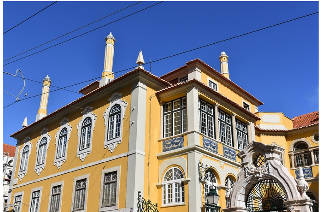
New head office of IFCM, Palacete dos Condes de Monte Real, Lisbon

IFCM è lieta di annunciare che la nuova versione dello Statuto , la costituzione di IFCM , come pure le nuove direttive di policy interne sono state approvate all'unanimità dall'Assemblea Generale. Tutti questi nuovi documenti sono consultabili cliccando sul loro nome.