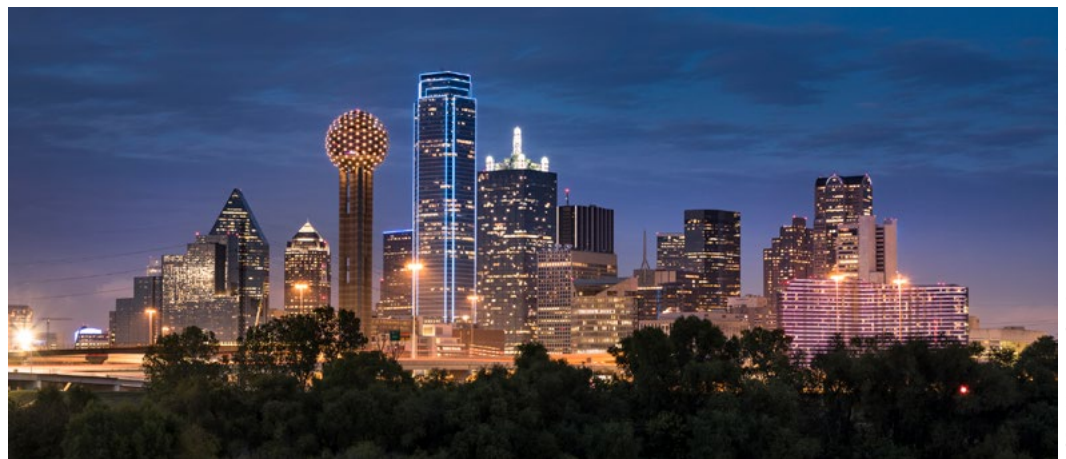
ACDA National Conference 2021 (Dallas, Texas), USA

Il gruppo è gestito da un comitato stabile sulle Attività Internazionali ed è un altro modo per tenersi aggiornati sulle attività internazionali di ACDA oltre che mettere in comune le proprie esperienze.