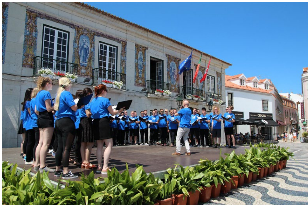
World Youth Choir 2019, Conducted by Josep Vila i Casañas, in Cascais, Portugal

Para más detalles, artículos y fotos de la sesión de WYC 2019, visite el sitio web de WYC – Facebook – Instagram