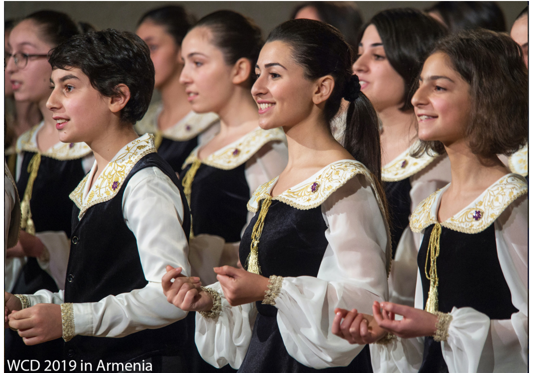
WCD 2019 in Armenia

여러분의 이벤트나 계획을 여기( here )에 올려주세요. 여러분의 노래와 함께 30주년 행사에 참가하세요!