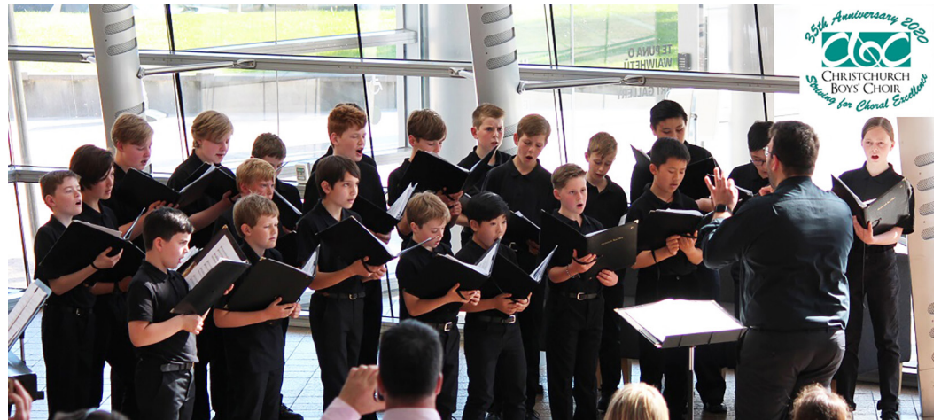
On Nov. 28, the Christchurch Boy's Choir dedicated their 35th Anniversary concert to the World Choral Day

상세 정보: World Choral Day . 콘서트 등록/구독: here