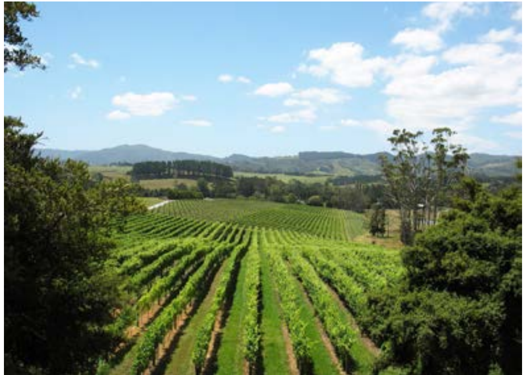
Wineyards on Waiheke Island