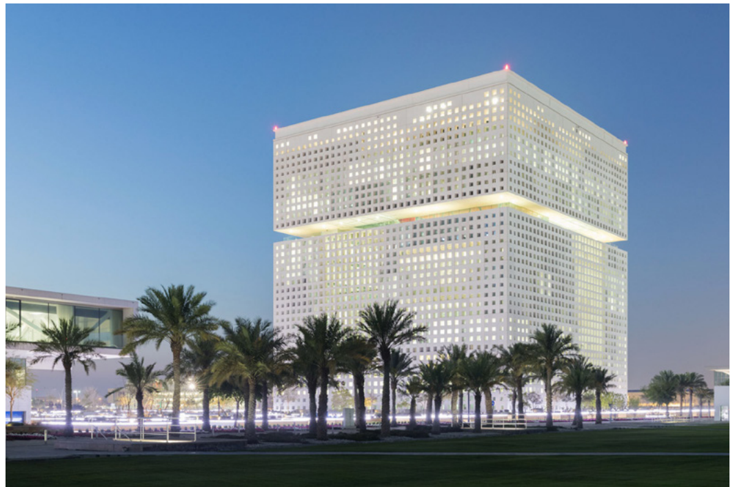
Qatar Foundation Headquarters in the evening