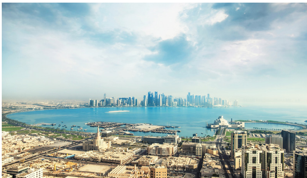
West Bay skyline, Doha, Qatar