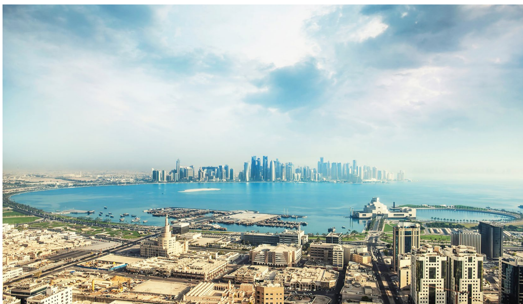
West Bay skyline, Doha, Qatar