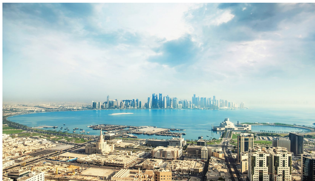
West Bay skyline, Doha, Qatar