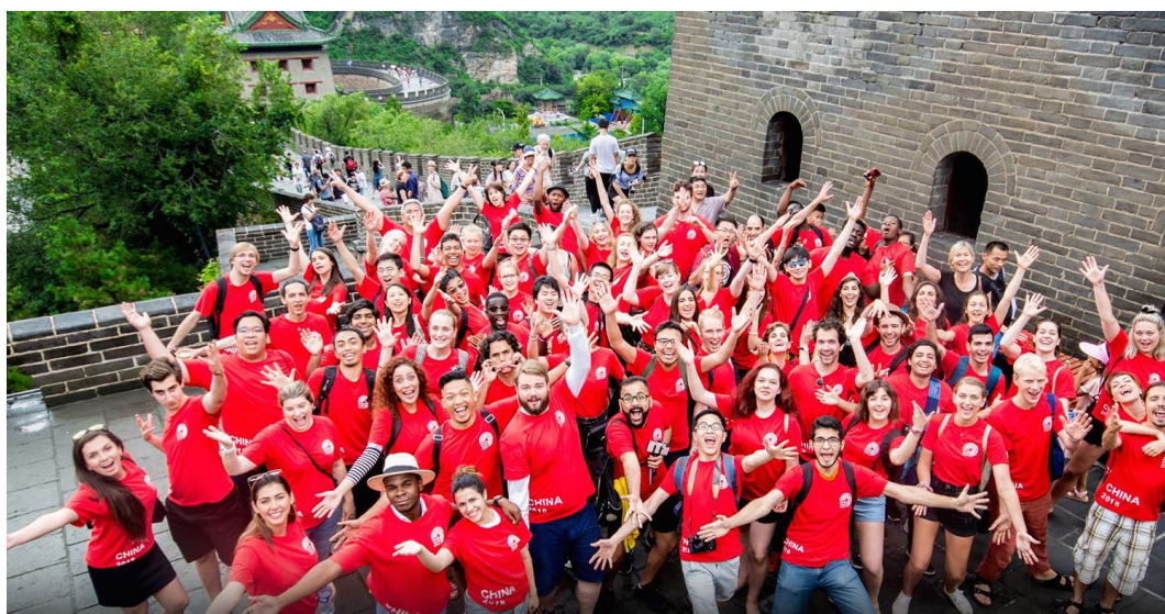
WYC 2018 on the Great Wall of China