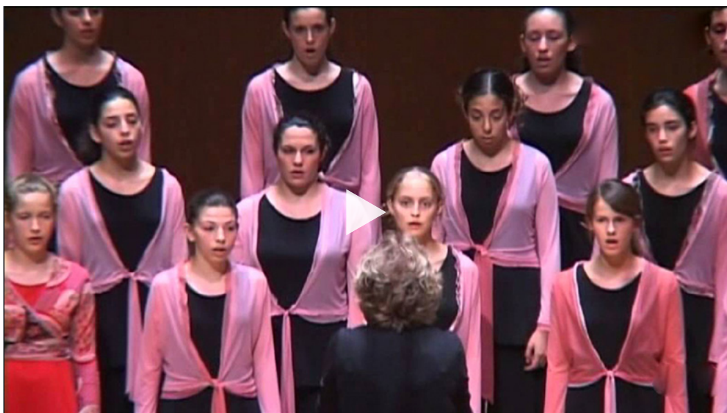
"Efroni hor" - 2 pjesme iz tradicije Jemenita