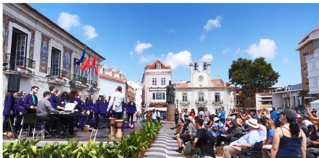
World Choral Expo 2019 in Cascais, Portugal