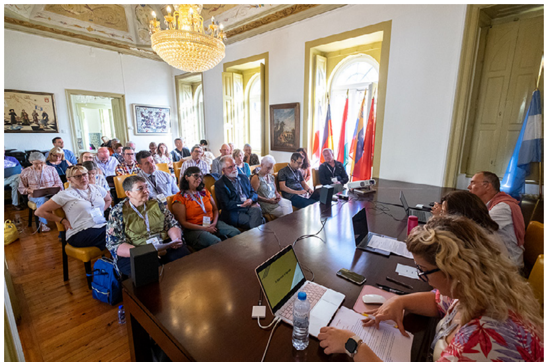
IFCM 2022 General Assembly at the Palacete dos Condes de Monte Real