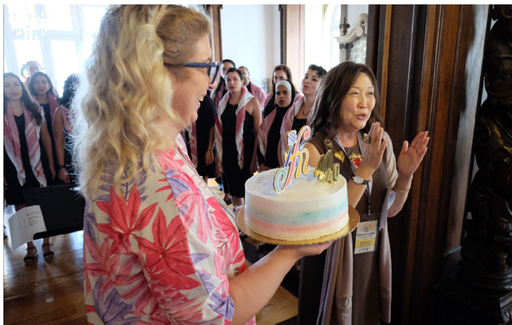
Happy Birthday IFCM!

*Члены IFCM проголосовали за важные изменения в Уставе и документе о политике членства. Эти изменения, которые вступят в силу на следующей Генеральной Ассамблее IFCM (2023 год), повлияют на систему голосования и выборы IFCM. Пожалуйста, следите за новостями, чтобы узнать больше об этих изменениях в следующем выпуске IFCMeNEWS и в Интернете.