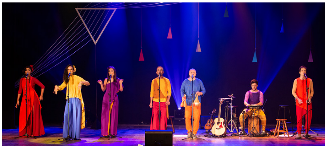
Ordinarius © Ana Rezende