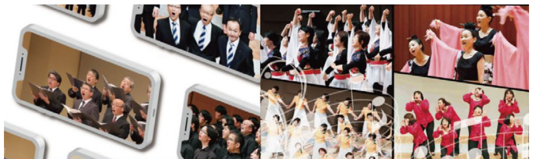
2021 JCA Men's Chorus Online Festival