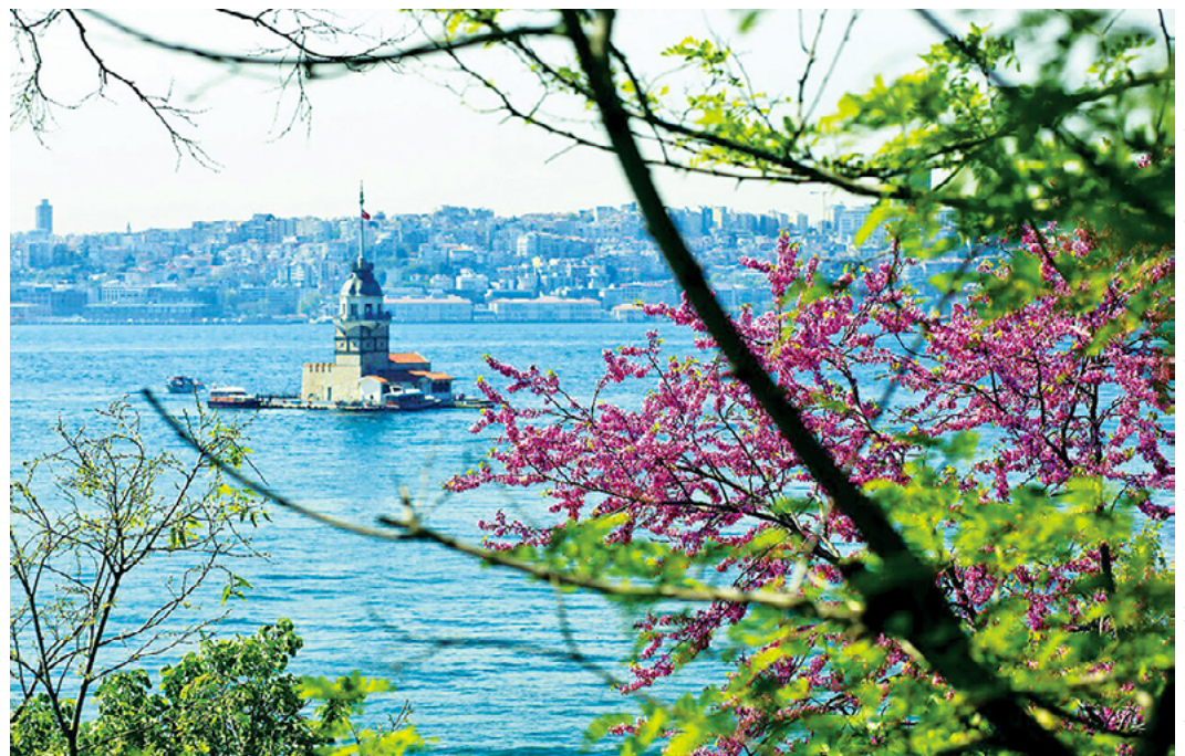
Judas trees blossoming before Maiden's Tower © Kiz Kulesi

伊斯坦布尔世界合唱音乐研讨会 (2023 年 4 月 25 日至 30 日) 当我们准备迎接 2023 年时，WSCM 的兴奋不仅在伊斯坦布尔，而且在全世界都在升温。快来注册将在贝伊奥卢 (Beyoglu) 举行的研讨会！贝伊奥卢是伊斯坦布尔最受欢迎的旅游胜地之一。在为期 6 天的研讨会期间，来自 5 大洲的 11 支合唱团和来自 26 个国家的 37 位演讲者将在 10 个不同的场地参加。超过 16,000 名观众将在拥有 2040 个座位的歌剧院和其他场地参加研讨会。如果您想参加这个将在伊斯坦布尔最美丽的场所举行的研讨会，请预订您的位置。有关应用程序