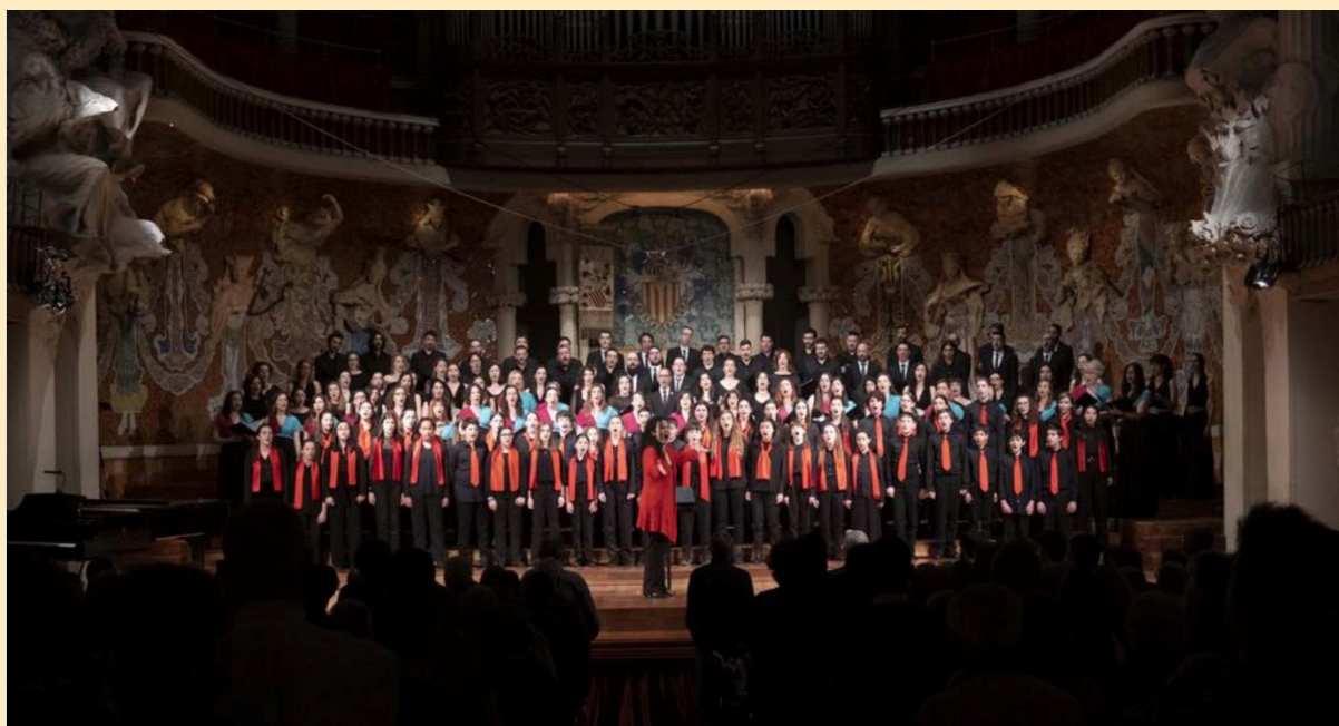
Festa de la Música Coral 2023

カタルーニャ・オルフェオ・コンクール( Catalan Orfeo Competition )には、51 の国から 219 名の作曲家が参加しました。寄せられた楽曲はトータル 362 曲です。また、FCEC 賞( FCEC Awards )には、49 名の作曲家から 90 作品が寄せられました。優勝者は、最優秀アカペラ作品賞を獲得したカルレス・プラット・ビベスとホアキム・バディア・アルミ、そして、最優秀カタルーニャ民謡アカペラ合唱編曲賞を獲得したアンドリュウ・ディポルト・フェリウです。カタルーニャ・オルフェオ・コンクールでは、ヨナタン・ラネとゲラール・ロペス・ボアダが最優秀合唱作曲賞を勝ち取りました。受賞作品は、2024 年 3 月 3 日の“合唱音楽祭”において、バルセロナのカタルーニャ音楽堂で初演されます。このイベントは、カタルーニャの合唱音楽を讃え、新たな作品の創作とこの地方の音楽遺産の保存を推進するものです。詳しくはこちらをごらんください。 more