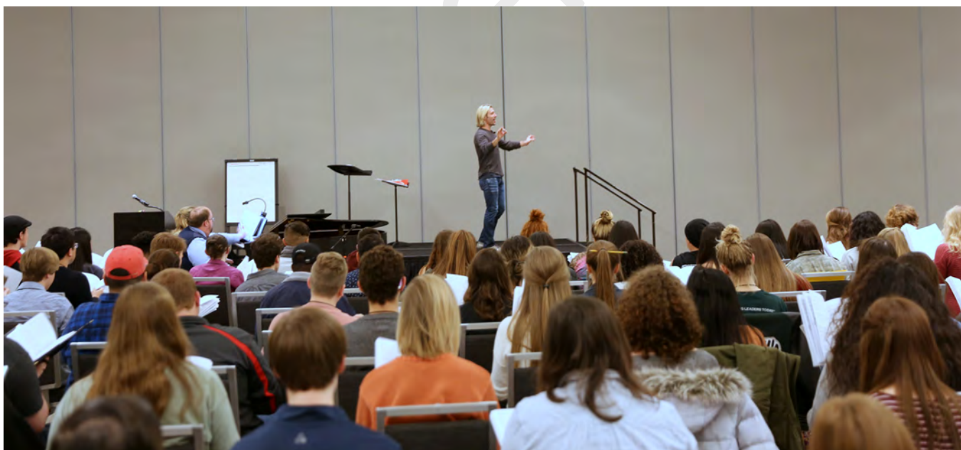
Une répétition du Chœur d'Honneur ACDA du Secondaire, dirigé par Eric Whitacre.

Une merveilleuse semaine musicale a apaisé les âmes angoissées. La prochaine Convention ACDA aura lieu à Kansas City dans le Missouri, en février ou mars 2019, qui sera également le sixième anniversaire d'ACDA.