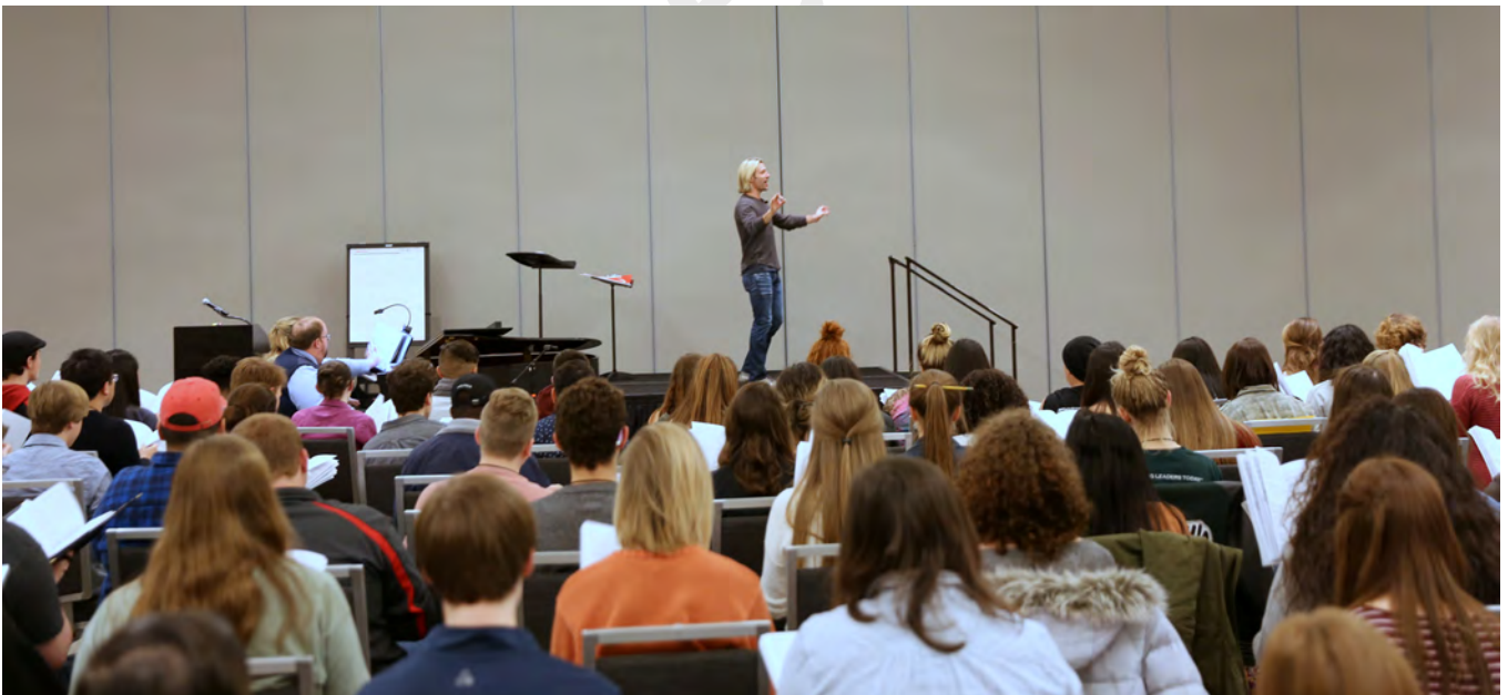
The National High School Honor Choir directed by Eric Whitacre, accompanied by the Minnesota Orchestra.

Eine wunderbare Woche schöner Musik war Balsam für die geschundene Seele. Die nächste Nationale Konferenz der ACDA wird in Kansas City, Missouri, im Februar/März 2019 stattfinden. Das wird das diamantene Jubiläum der American Choral Directors Association sein.