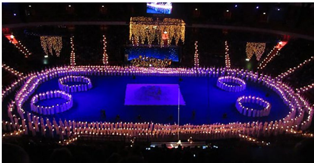
1400 Singers from Adolf Fredriks Music Classes and the Stockholms Musikgymnasium during a Lucia concert celebrated together with the World Choral Day

第12回世界合唱シンポジウム(WSCM2020) キア・オラ・コウトウ(みなさん、こんにちは) ニュージーランド・アオテアロアからご挨拶