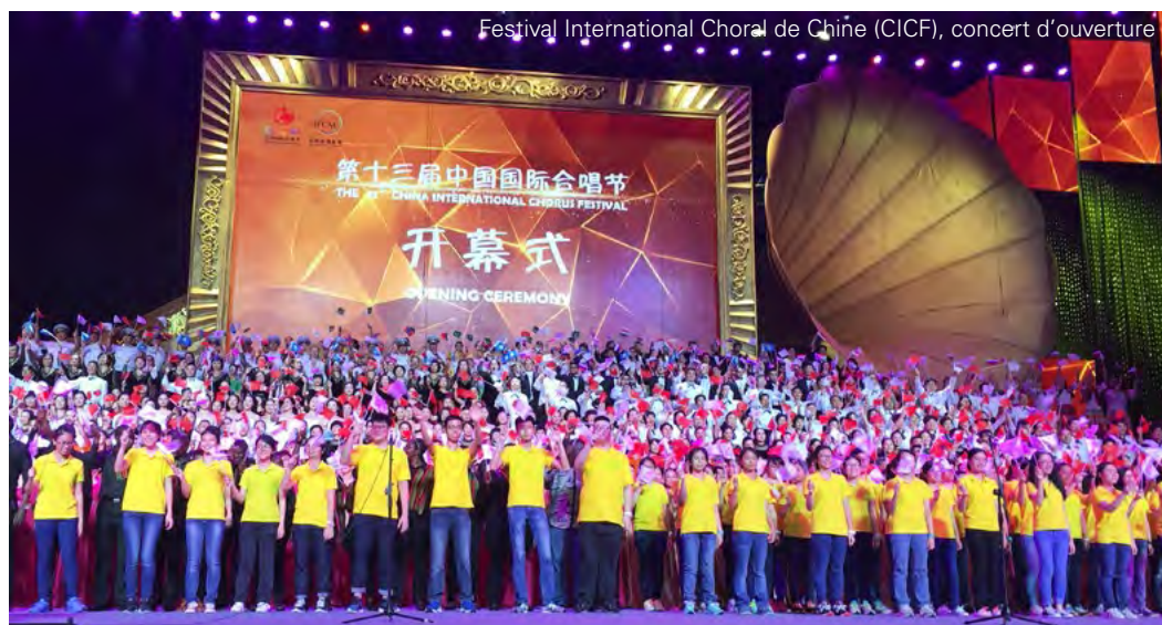
Festival International Choral de Chine (CICF), concert d'ouverture