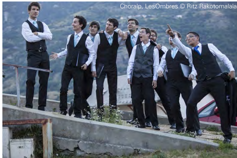
Choralp, Les Ombres

問い合わせ先: choralp@gmail.com ウェブサイト: www.choralp.fr