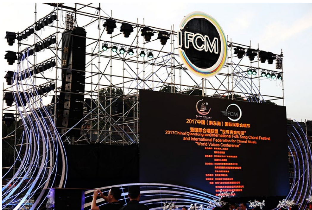
International Folk Song Choral Festival and IFCM Voices Conference 2017

¿BUSCAS UNA GIRA DE CONCIERTOS EN CHINA EN JULIO DE 2018? ¡AQUÍ HAY UNA OPORTUNIDAD EXCLUSIVA!