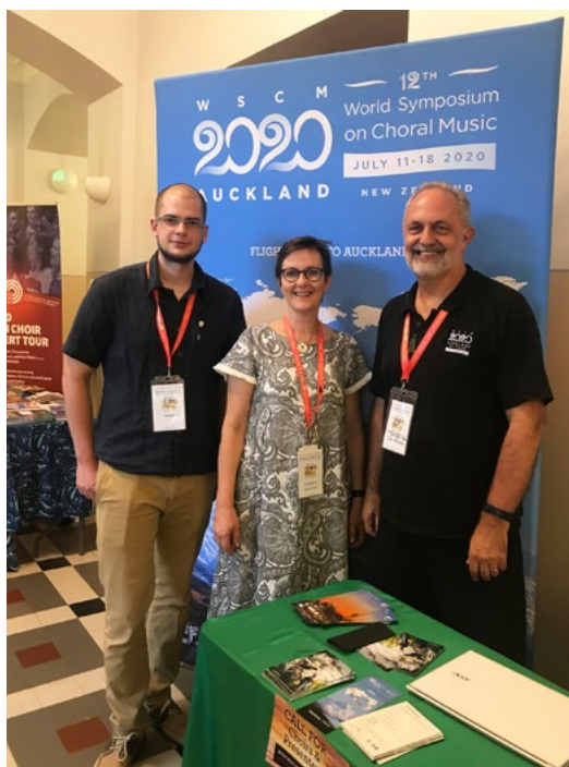
Il team di IFCM/WSCM2020 a Tallinn