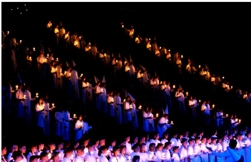
Picture: 1400 Singers from Adolf Fredriks Music Classes and the Stockholms Musikgymnasium celebrating the World Choral Day during their annual Lucia concert

Nel 2018, una speciale ricorrenza rende il World Choral Day ancora più significativo - il centenario della fine della Prima Guerra Mondiale allarga la durata temporale di questo evento globale e apre ad una partecipazione virtuale in un periodo più grande di un mese!