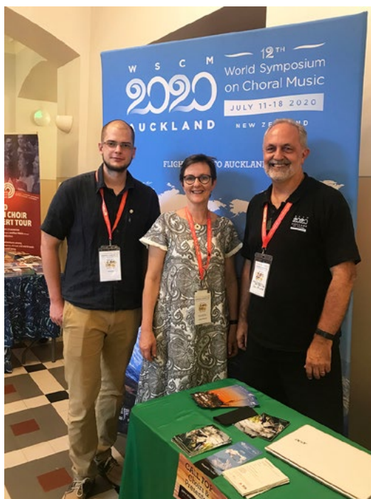
キャプション: タリンでのIFCM/WSCM2020チーム

これは、WSCMへの参加が見込める人々や、現在、申し込み準備中の合唱団団長・合唱関係者、および、オーケランドのWSCM音楽博覧会を訪れるであろう作曲家や出版業者と非常に深い話をするすばらしい機会となりました。