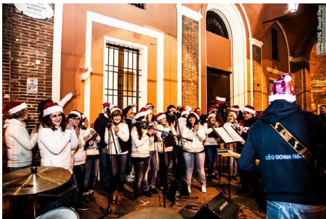
Coro Giovani Fabrianesi, Italie, célébrant la Journée mondiale du Chant choral (2014)

世界の平和と協調の声明として、作品の第1部と第3部は、世界中の個人の歌手により演奏されます。このグローバルなプロジェクトに参加したい方は、10月7日までにご自身の録音を提出するようお願いいたします。詳しくは、こちらでご確認ください。 https://www.ciccag.org/en/virtual-choir-voxpathuli/ すべての録音はFundación Aequalisにより編集・合成され、最後に動画が制作されます。この動画は、世界合唱の日を祝うものとしてリリースされ、ソーシャルメディアや個別のウェブサイトで配信されます。このプロジェクトについて、もっと知りたい方は、IFCM( communication@ifcm.net )、または、カラカスのFundación Aequalis( info@ciccag.org )にお問い合わせください。また、こちらでも情報をごらんになれます。 https://www.ciccag.org/en/virtual-choir-voxpathuli/