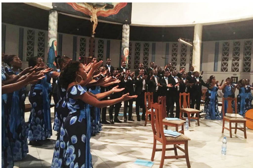
Choral Days A Coeur Joie Gabon: Grand Choeur A Coeur Joie Gabon, Groupe Vocal Le Chant sur la Lowé, La Voix des Jeunes and Dominique Savio (Closing concert of A Coeur Joie choral week and training session in Libreville and Port-Gentil, Gabon)

Per maggiori informazioni, visita: www.worldchoralday.org