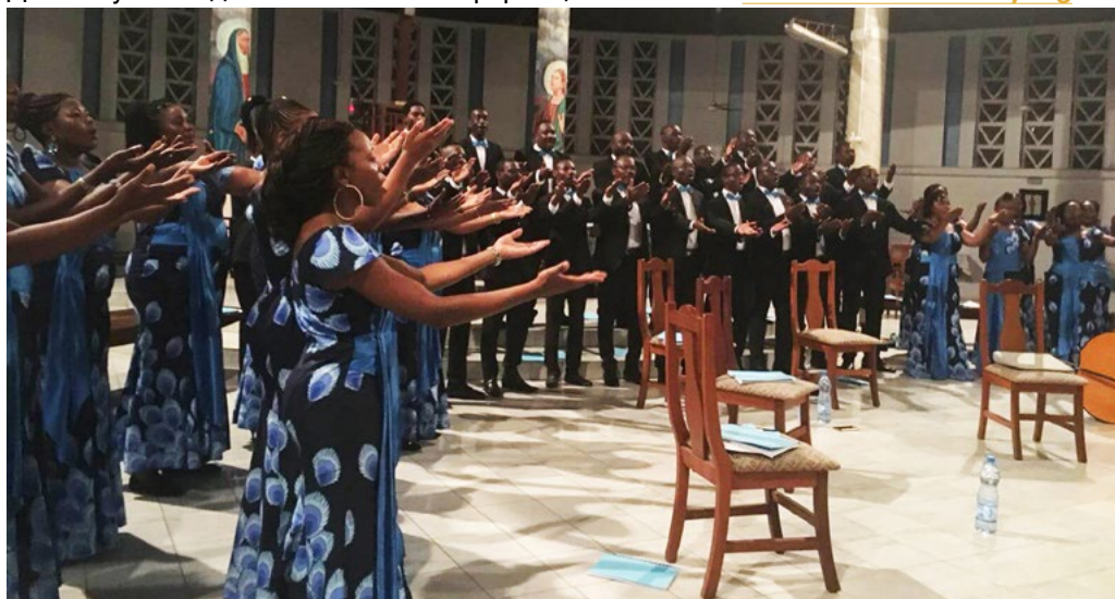
Choral Days A Coeur Joie Gabon: Grand Choeur A Coeur Joie Gabon, Groupe Vocal Le Chant sur la Lowé, La Voix des Jeunes and Dominique Savio (Closing concert of A Coeur Joie choral week and training session in Libreville and Port-Gentil, Gabon)

Для получения дополнительной информации посетите: www.worldchoralday.org