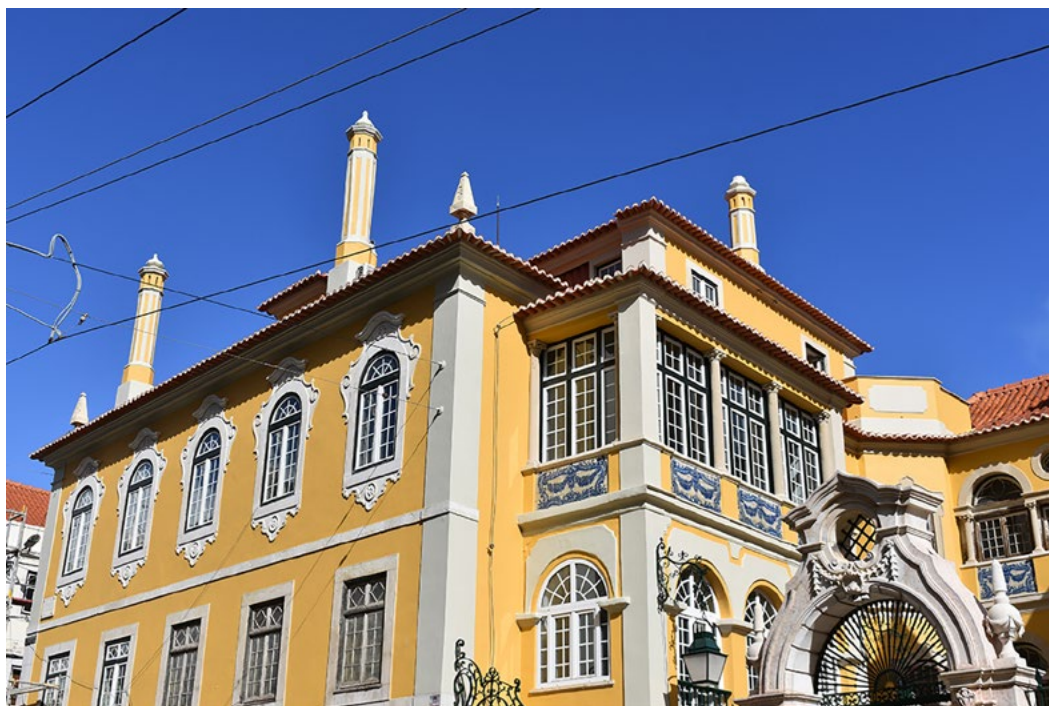
New head office of IFCM, Palacete dos Condes de Monte Real, Lisbon

IFCM è lieta di annunciare che la nuova versione dello Statuto , la costituzione di IFCM , come pure le nuove direttive di policy interne sono state approvate all'unanimità dall'Assemblea Generale. Tutti questi nuovi documenti sono consultabili cliccando sul loro nome.