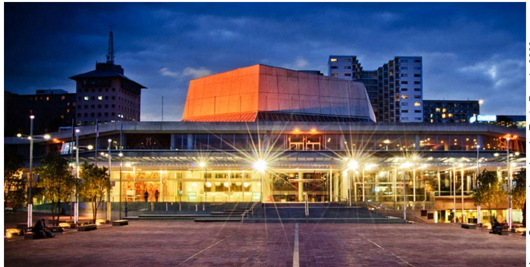
Aotea Centre welcoming the Trade Expo in 2020

엑스포는 2020년 7월 11일(토요일)부터 18일(토요일)까지 심포지엄 중요 행사장에서 8일간 진행됩니다. 전시 부스가 많이 남아있지 않으니 서둘러주세요. 지금 등록 ( Register now )하셔서 부스를 예약하시기 바랍니다. 엑스포 전시 부스 예약에 대한 상세정보는 엑스포 약관( here )을 참조하세요.