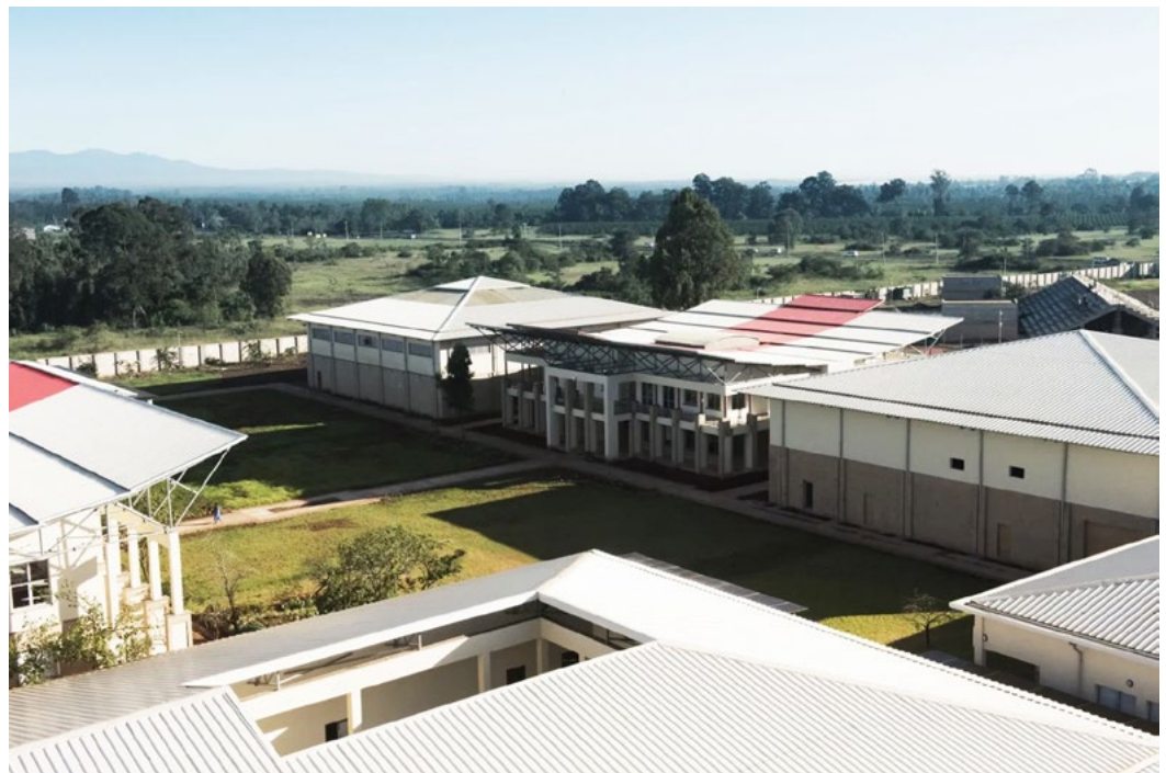
Mpresa Foundation Auditorium (center), one of the venues of the Festival

나이로비에 오셔서 아프리카의 여러 지역과 전 세계 국가들의 풍성하고 다양한 합창 음악을 즐기세요! Jambo Kenya!