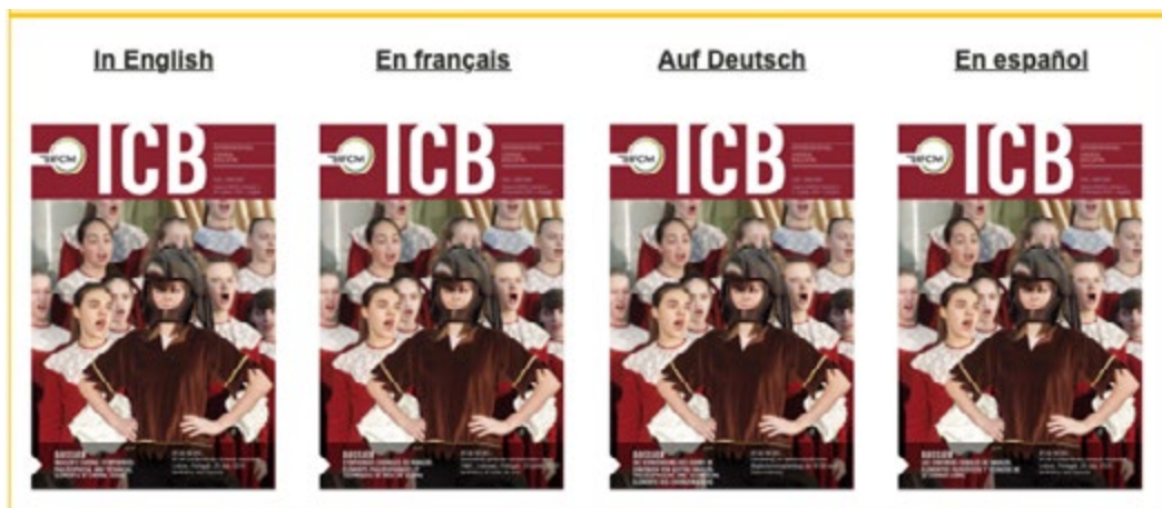
International Choral Bulletin, Volume XXXVIII, numéro 2, 2 ème trimestre 2019

simples traductions de l'ICB; une nouvelle page sur le site Web de la FIMC va être créée, entièrement en russe, avec un accès facile pour les visiteurs russophones. Les articles de l'ICB (ainsi que la IFCMeNEWS ) ont déjà été publiés en chinois sur le compte WeChat de la FIMC au cours des 10 derniers mois. L'équipe du WSCM 2023 à Doha travaille activement sur la création d'un réseau de traducteurs des pays arabes.