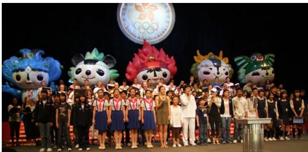
Choeur mondial des jeunes 2008 lors d'un concert pour les Jeux olympiques d'été 2008