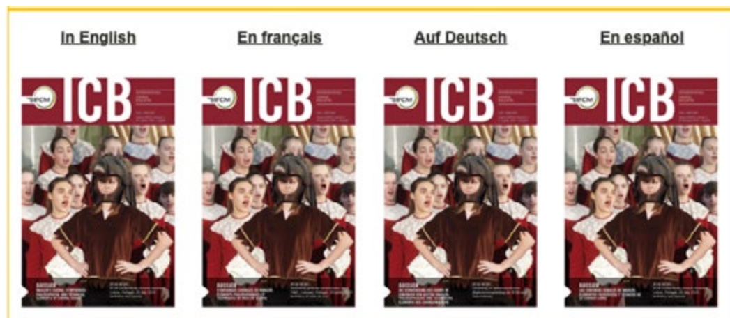
International Choral Bulletin, Volume XXXVIII, Number 2, 2 nd Quarter, 2019

ya se han publicado en chino en la cuenta de IFCM WeChat durante los últimos 10 Meses. El Equipo WSCM 2023 en Doha está creando activamente una red de traductores de países árabes.