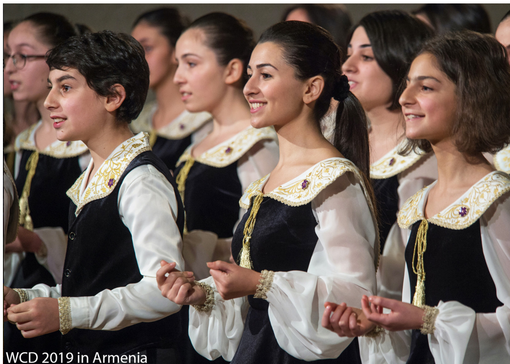
WCD 2019 in Armenia

Machen Sie mit beim dreißigsten Jahr des Singens!