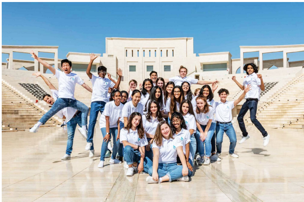
Qatar Youth Choir, Cond. Alena Pyne

目下、この委員会はプログラムの中東の部の構成をアシストする現地芸術顧問委員会を設置しようとしています。これらのメンバーが力を結集すれば、世界および中東の最高峰から、WSCM2023のステージや演壇に代表が送り込まれることは確実となります。