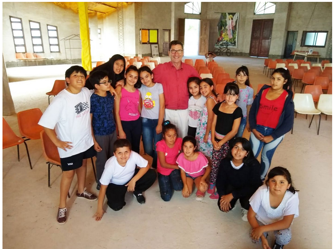
CWB in Argentina in 2019

Zusätzlich zu Präsenz-Arbeitsphasen soll in allen Regionen Video-Training für grundlegende Dirigiertechniken organisiert werden, ein kostengünstiger und pädagogisch erfolgreicher Weg, den CWB bereits in Lateinamerika geht.