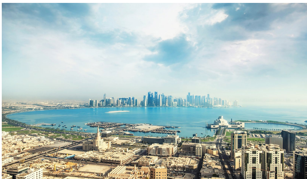
West Bay skyline, Doha, Qatar