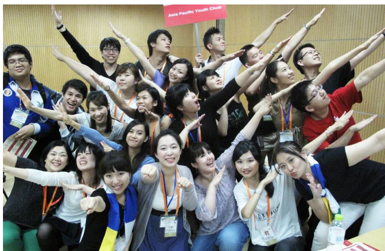
One of the first sessions of the Asia Pacific Youth Choir