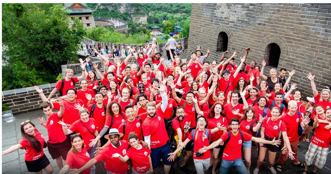
WYC 2018 on the Great Wall of China

Angeichts der ungewissen globalen Situation für den Rest von 2021, hat das Präsidium der WYC-Stiftung beschlossen, keine reguläre Arbeitsphase für 2021 zu planen. Zur