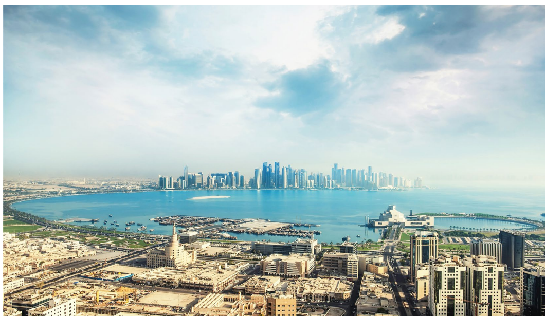
West Bay skyline, Doha, Qatar