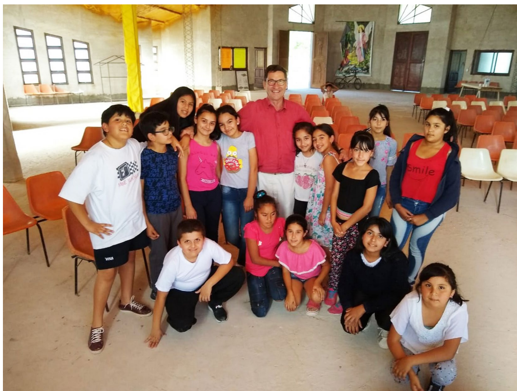
CWB in Argentina in 2019

Oltre alle sessioni in presenza, verranno sviluppate in tutte le regioni sessioni di formazione video sulle tecniche di base della direzione, un approccio economicamente vantaggioso e pedagogicamente effettivo già utilizzato da CWB nell'America Latina.