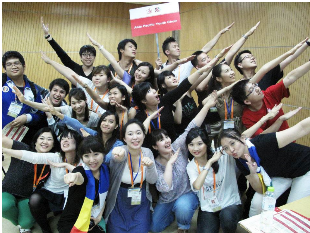
One of the first sessions of the Asia Pacific Youth Choir