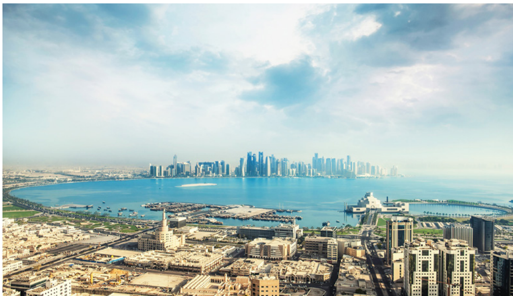
West Bay skyline, Doha, Qatar