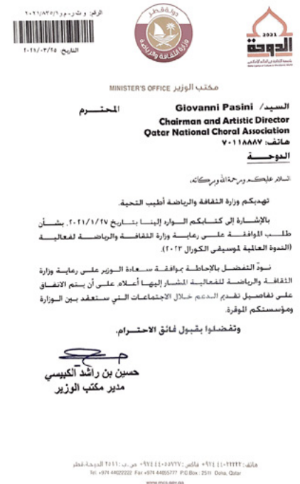
Right: West Bay skyline, Doha, Qatar — Left: the letter from the Ministry of Culture and Sports confirming its patronage