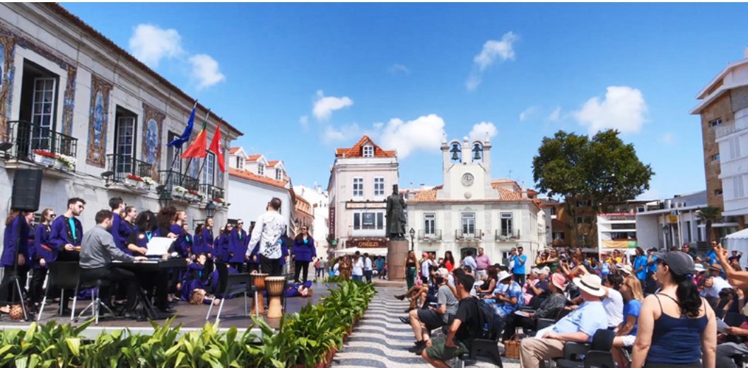
World Choral Expo 2019 in Cascais, Portugal