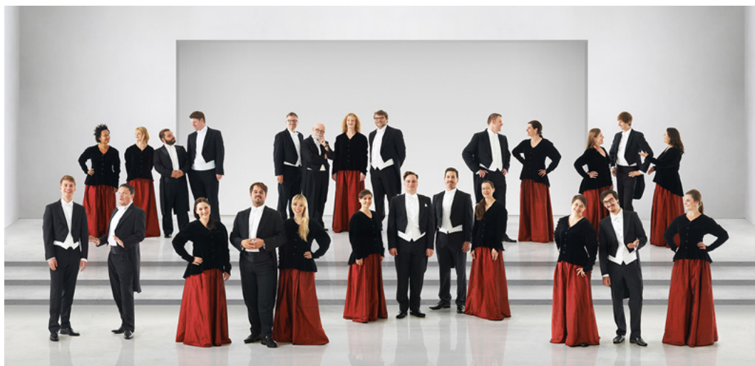
Kammerchor Stuttgart

Хор выступает на всех крупнейших европейских фестивалях и дает концерты во многих прославленных концертных залах. “Kammerchor Stuttgart” был приглашен на три Всемирных симпозиума по хоровой музыке (в Вене, Сиднее и Сеуле), а также на 12-й WSCM в Окленде в 2020 году. Регулярные концертные туры в Северную и Южную Америку, Азию и Израиль подтверждают всемирную известность “Kammerchor Stuttgart”. 45 альбомов с музыкой хора из ста были удостоены международных наград, таких как Edison, Diapason и ICMA.